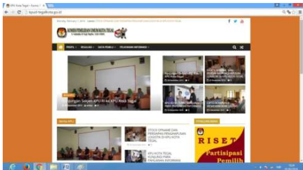
Gambar 1. Tampilan Laman resmi KPU Kota Tegal

Selain itu KPU Kota Tegal juga melakukan upaya lain untuk memberikan akses kepada masyarakat yang lebih luas dengan membuat akun Facebook dan twitter sebagai berikut