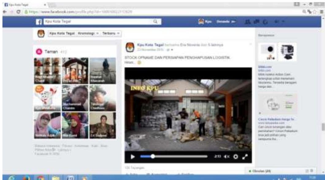
Gambar 2. Tampilan Akun Facebook KPU Kota Tegal