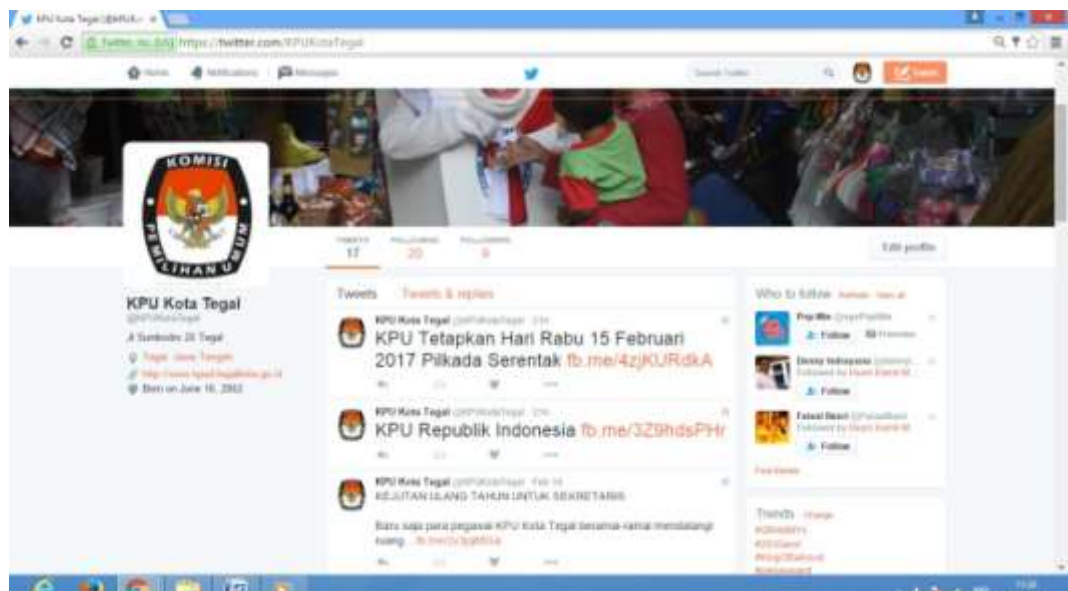
Gambar 2. Tampilan Akun Twitter KPU Kota Tegal