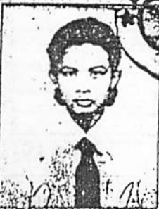
(R. PRATISNO) tanda tangan pemegang